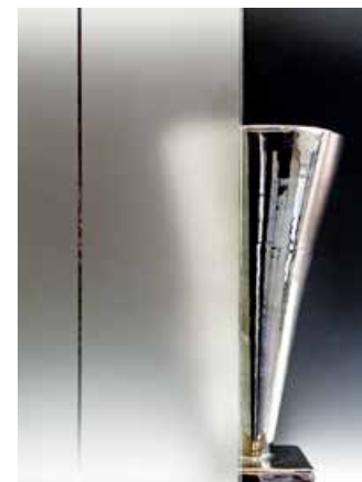
SatenLíneas Pantalla / Screen

SatenDecor ® y CriSamar ® son marca registrada de SEVASA. SatenDecor ® and CriSamar ® are trademarks from SEVASA.