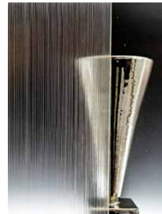
Líneas-S Satinado / Satin