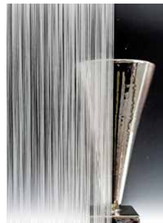
Líneas Dinamic 3D motion